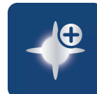
До 4000 К

Кристалльно-белый свет с эффектом светодиодного освещения – для стильного облика автомобиля